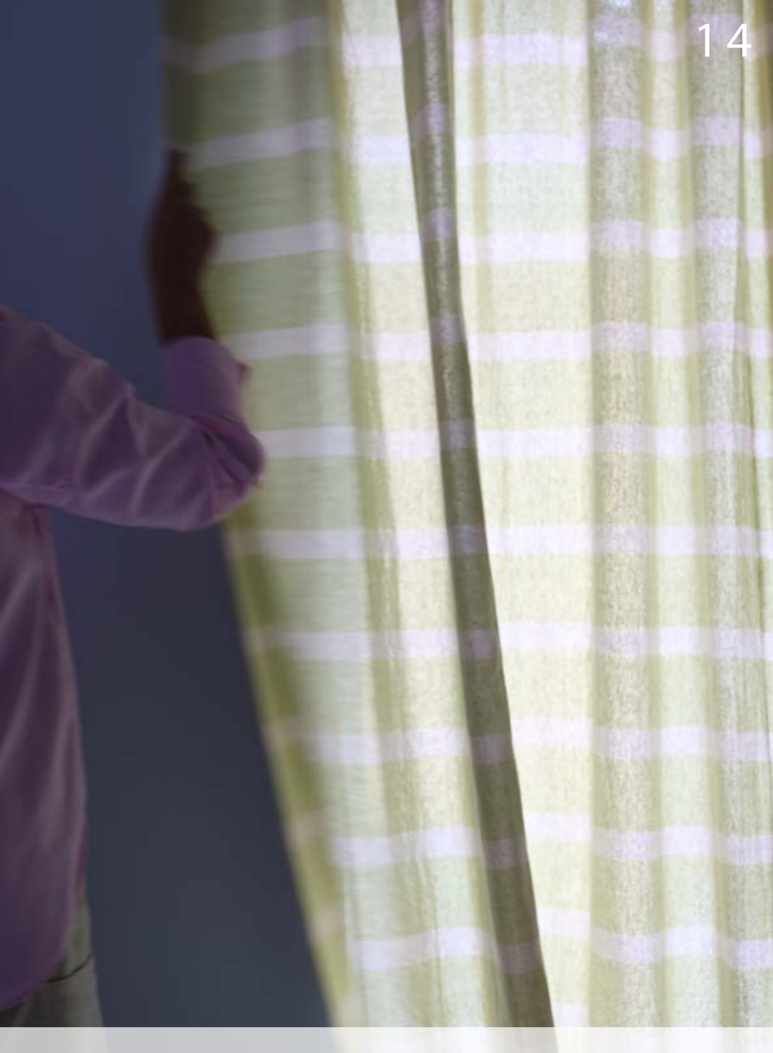
14 Cortina: Haste I - Cor Off White/Verde Limão/Lurex Gold